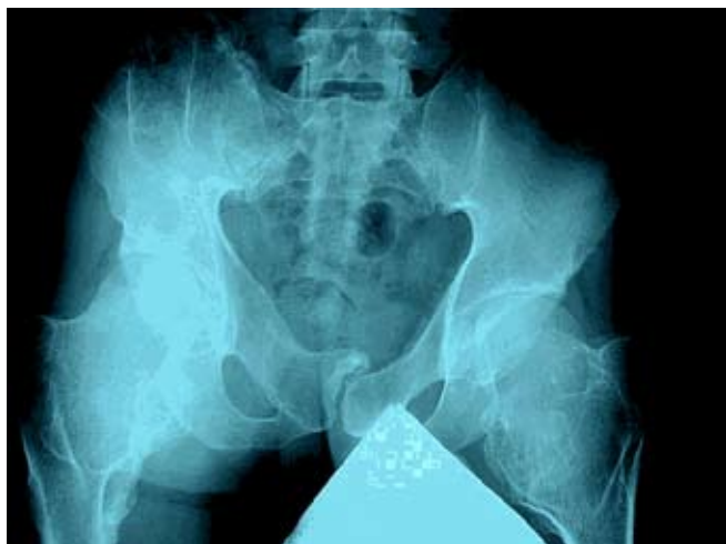
Figuur 7 Typische steile heupen bij patiënten met HME (ononderbroken pijl wijst op de steile hoek). De metafyse is erg breed (onderbroken pijl).

Exostosen gelokaliseerd aan de bovenzijde van het bovenbeen kunnen resulteren in bewegingsbeperking en dwangstand van de heupgewrichten. Zo wordt vaak gezien dat de heupen bij patiënten met HME “steiler” zijn dan normaal (Figuur 7). Wanneer deze hoek te groot wordt kan dit zelfs leiden tot een beeld zoals gezien wordt bij kinderen met aangeboren heupdysplasie.