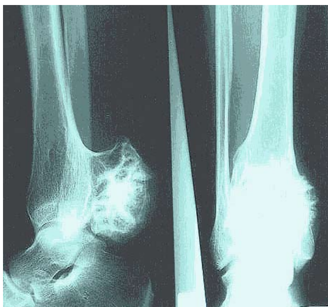
Figuur 2 Exostose is hier door middel van een brede basis verbonden aan het bot.

De vorm van de exostosen is tamelijk grillig en varieert van een van het gewricht af gerichte puntige exostose (gesteeld) (Figuur 1) tot een brede gezwelachtige vervorming (brede basis) (Figuur 2).