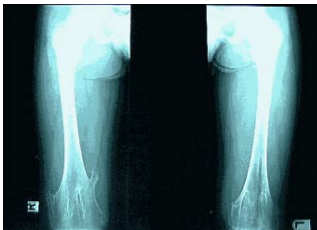
Figuur 1 Exostose is hier door middel van een steeltje verbonden aan het bot.

De exostosen worden meestal pas opgemerkt op de peuter- of kleuterleeftijd en hebben de neiging tijdens de groei steeds groter te worden.