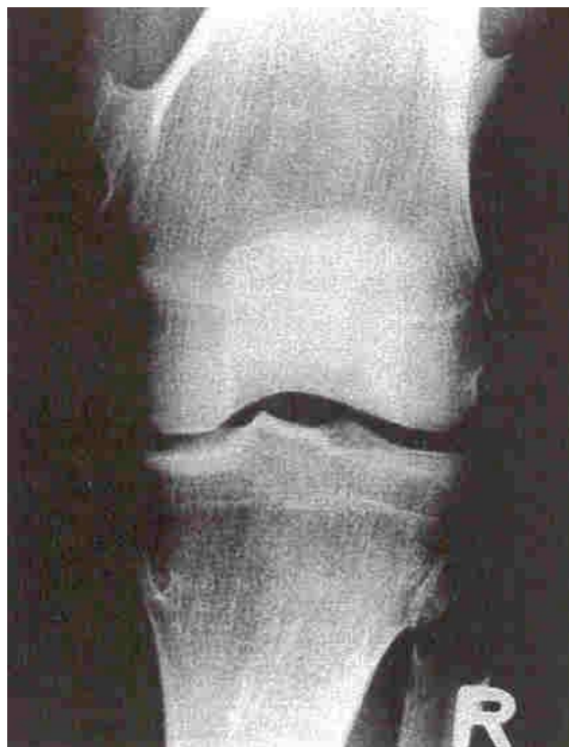
Figuur 4 Aanwezigheid van multiple exostosen aan het scheenbeen/tibia, kuitbeen/fubula en bovenbeen/femur van een HME-patiënt.

HME is als klinische diagnose vaak eenvoudig vast te stellen aan de hand van röntgenfoto's, (Figuur 4) soms is aanvullend onderzoek nodig.